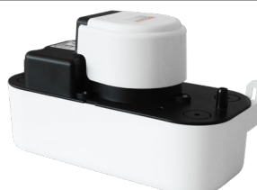
FLOWATCH® TANK+ 2.5