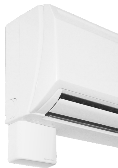
FLOWITA EVO DT20