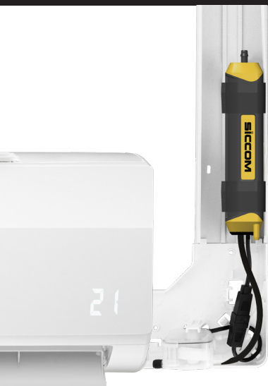
FLOWATCH SILENCE DESIGN DT20

*Misurato su FLOWATCH SILENCE DESIGN DT20