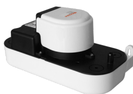
FLOWATCH® TANK+ 1.2