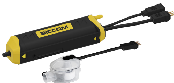
FLOWATCH SILENCE DT20