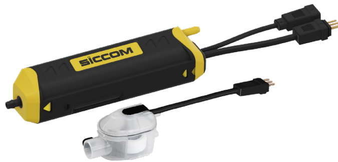
FLOWATCH SILENCE DT20