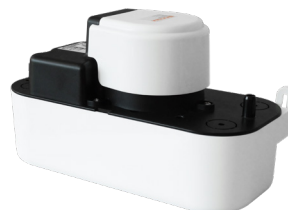
FLOWATCH® TANK+ 2.5